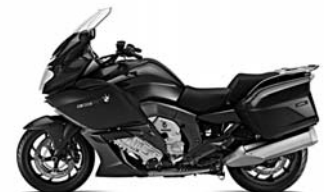
Dunkelgraphit metallic NB2