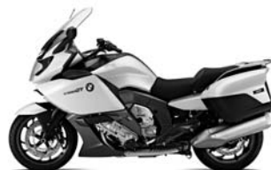
Lightgrey metallic N38