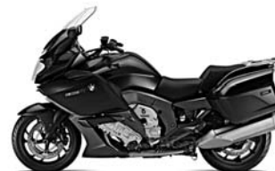
Montegoblau metallic NA9