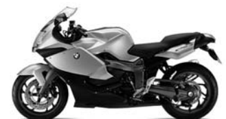
Titansilber metallic/ Saphirschwarz metallic N81