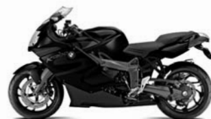
Saphirschwarz metallic/ Darkgraphit metallic NB3