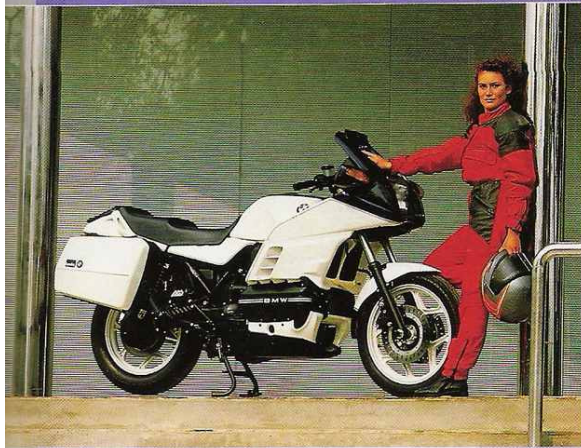
Een speciale uitvoering van de K100RS, die daarom Special is genoemd

Een grote blikvanger op de onlangs gehouden IFMA in Keulen was de BMW K1. Ongetwijfeld zal er voor het topmodel van de Duitse fabrikant ook in Amsterdam veel belangstelling bestaan. Net als twaalf jaar geleden met de R100RS heeft BMW ook nu weer baanbrekend werk verricht op het gebied van de aërodynamica. De in de windtunnel opgedane ervaringen hebben het uiterlijk van de K1 van voor tot achter volledig bepaald. Met de K1 beschikt BMW momenteel weer over een echt topmodel. Dat is ook de doelstelling van de Beierse fabrikant, gelet op de benaming. Naar analogie met de auto's (M1 e.d.) komt in de type-aanduiding de cilinderinhoud niet naar voren, iets dat bij alle andere modellen van BMW wel het geval is. De K1 onderscheidt zich niet alleen door het uiterlijk van de overige BMW's, ook op technisch gebied is er veel veranderd. Nieuw voor BMW is de keuze van een vierklepskop. Verder regelt het nieuwe Bosch Motronic-systeem computergestuurd zowel de benzine-inspuiting als de ontsteking.